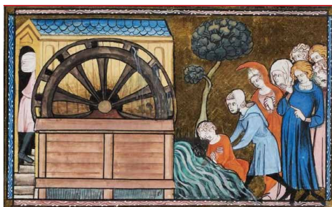
ms franc 5716, fol 288

Par Jean-François Moufflet , conservateur en chef, Archives nationales Conférence sur la célèbre fin des Templiers et sur le rouleau qui en conserve la trace.