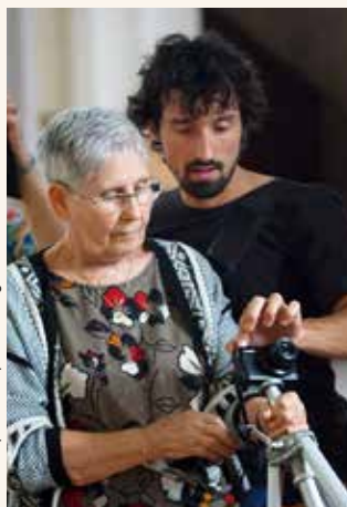
Bibliothèque municipale de Nogent-sur-Seine