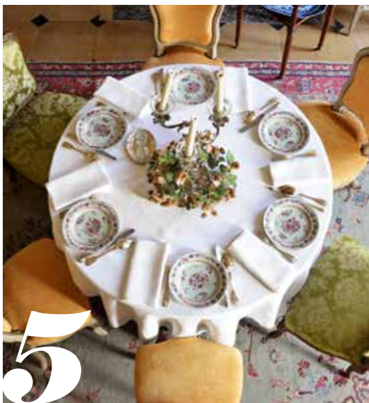
Château de la Motte-Tilly

➤ Cité du vitrail. Tél : 03 25 42 52 87. www.cite-vitrail.fr