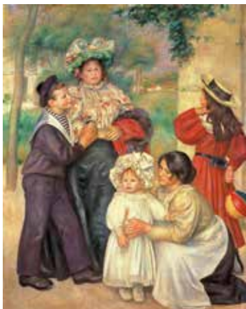
The Barnes Foundation, Merion, Pennsylvania

L'année 2019 marque le centenaire de la mort du peintre Pierre-Auguste Renoir. Cette commémoration sera marquée, en France, par nombre d'événements. La commune d'Essoyes s'y associe à travers une évocation des Renoir, "une famille d'artistes" (photo). Hasard de la vie ? L'année 2019 marque aussi les 40 ans de la mort de Jean le cinéaste (fils cadet), les 50 ans de celle de Claude le céramiste (benjamin) et les 60 ans de la mort de Gabrielle, modèle favori du peintre.