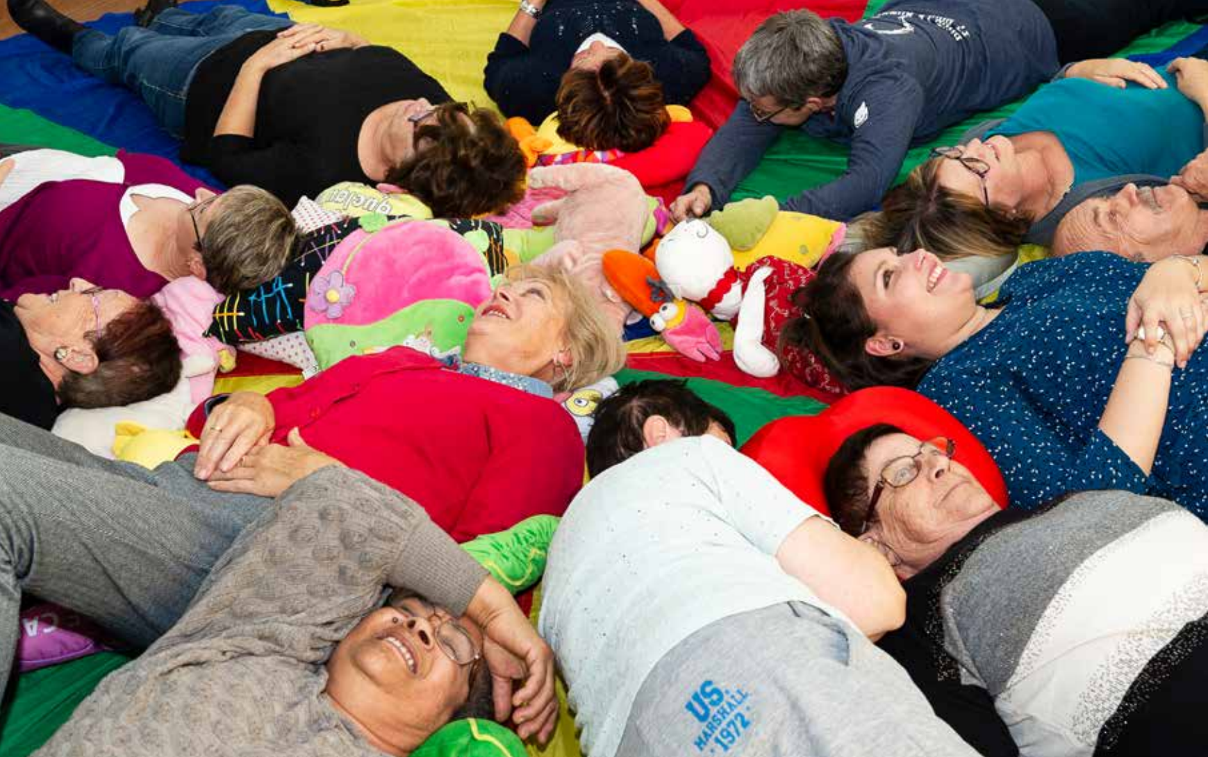
Atelier Rigologie, avec l'ADMR, à Méry-sur-Seine. Pour être bien dans sa tête, bien dans son corps et bien avec les autres.