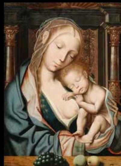
Atelier de Quentin Metsys (début XVI e s.)

Portrait d'un Lord, huile sur toile. Incursion dans la peinture anglaise, peu fréquente dans les collections françaises.