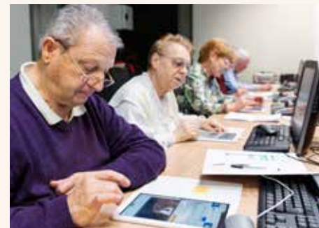
Découverte de la tablette numérique avec l'Asimat, à Pont-Sainte-Marie.

bibliothèques animé par le Département, ont retenu l'attention de la CFPPA. « Trois structures ont accueilli une activité clé en main autour du théâtre, détaille Anne-Sophie Reydy, directrice de la Bibliothèque départementale. Les autres ont élaboré un projet propre. Un défi pour ces structures, plus habituées à proposer des activités jeunesse ! » Ainsi, à Creney-près-Troyes, s'est-on initié au cartonnage pour mettre en lumière les souvenirs d'antan, tandis qu'à Nogent-sur-Seine, appareil photo en main, on a redécouvert la ville.