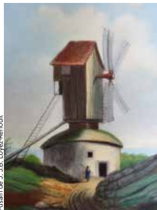
Fusain de J.-B. Loyez-Renoult

Sous la direction de Nicolas Hatot, éd. Snoeck. 35 €. Éclairage sur la communauté de Champagne.