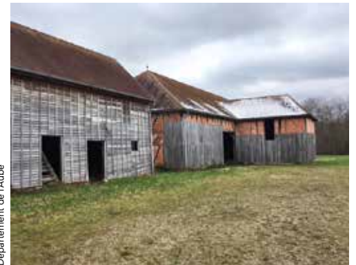
Département de l'Aube

Ils étaient 100 jeunes confiés à l'Aide sociale à l'enfance, diplômés en 2017-2018, à recevoir, fin octobre, les félicitations des conseillers départementaux, en même temps qu'un bon-cadeau. Âgés de 14 à 21 ans, ils ont obtenu, qui le brevet, qui le bac et même, pour certains, une certification dans l'enseignement supérieur. Par cette Cérémonie de la réussite – une première –, les élus souhaitent encourager ces jeunes, dont ils ont la charge, à poursuivre des études, si importantes pour leur avenir. Pour l'occasion, les jeunes étaient accompagnés de leurs parents, amis, d'un éducateur ou de leur famille d'accueil.