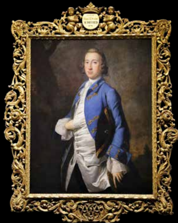
Thomas Hudson (XVIII e s.)

Texte : Marie-Pierre Moyot, avec le concours des musées de Troyes.