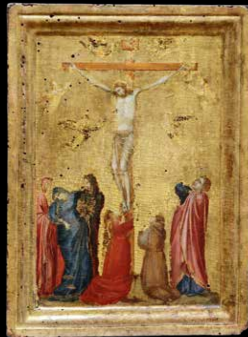
Ambrogio di Bondone, dit Giotto (début XIV e s.)

Éclairage performant, salles aux tons neutres rehaussées, çà et là, de cimaises colorées.