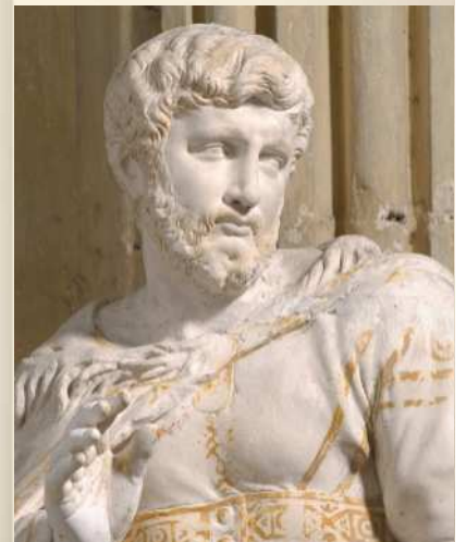
Saint Joseph et l'Enfant Jésus Bar-sur-Seine (10)

Né à Florence en 1501, et formé en Italie où il connaît l'influence de Michel-Ange, Dominique Florentin arrive en France et participe au chantier de Fontainebleau en 1537. De 1540 à 1550, il collabore avec Primatice et devient un des artistes les plus en vue. Sculpteur, peintre, graveur, mosaïste et céramiste, son activité se partage entre Troyes et les chantiers royaux. Son œuvre de graveur au burin est jalonnée de pièces qui permettent d'évoquer les influences dont il s'est nourri : Jules Romain, Michel-Ange, Primatice, Rosso... Après avoir marqué la sculpture champenoise, il s'éteindra à Troyes en 1571. Ses œuvres sont caractérisées par des visages au cou allongé et large, des yeux en amande, un nez long et une petite bouche. Les attitudes sont nobles, les visages expriment la douceur. A cela s'ajoute l'élégance des drapés, très travaillée. L'ensemble laisse transparaître beaucoup de grâce.