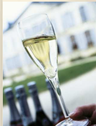
Le champagne, prestigieux symbole de la région

Mais la Champagne-Ardenne, c'est aussi le célèbre nectar qui contribue à faire briller le « savoir-vivre » à la française dans le monde entier. Vin d'exception, le champagne est l'un des grands symboles du patrimoine culturel régional. Les touristes du monde entier ne s'y trompent pas qui viennent chaque année plus nombreux pour visiter ses caves et suivre à flancs de coteaux le magnifique itinéraire de la Route touristique du champagne.