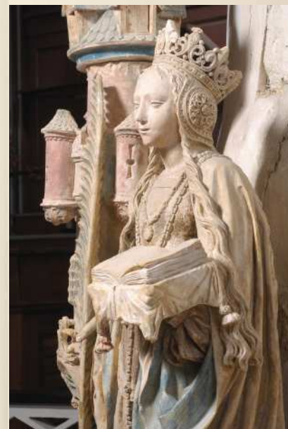
Sainte Barbe Villeloup (10)

Les nouvelles connaissances révélées par le comité scientifique de l'exposition seront mises en avant à cette occasion.