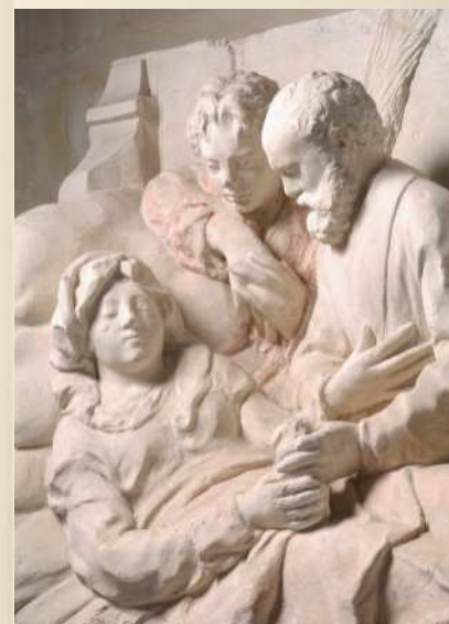
Mort de la Vierge Estissac (10)