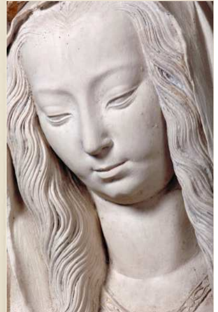
Vierge à l'Enfant Le Thoutt-Trosnay (51)

Une valeur émotionnelle forte irradie de ces sculptures immuables. C'est particulièrement vrai pour les représentations de la Vierge et de Jésus.