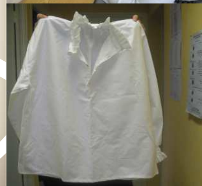
Local de développement social de Nogent-sur-Seine (Aube). Création de costumes Renaissance.