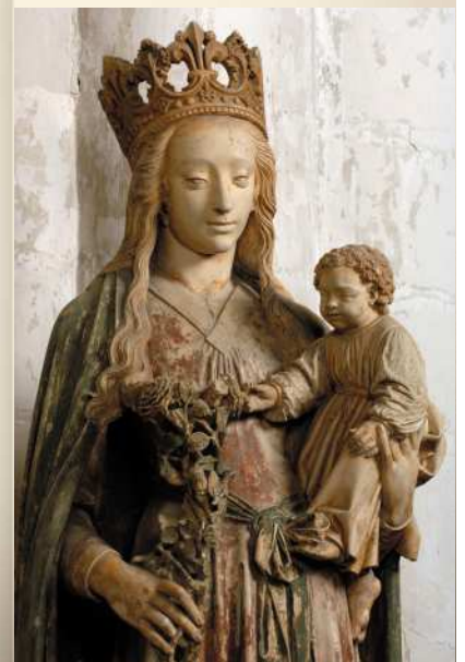
La Vierge à l'Enfant Mesnil-la-Comtesse (10)