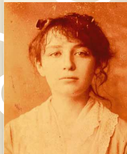
Camille Claudel par César (10)

Comité départemental du tourisme de l'Aube en Champagne