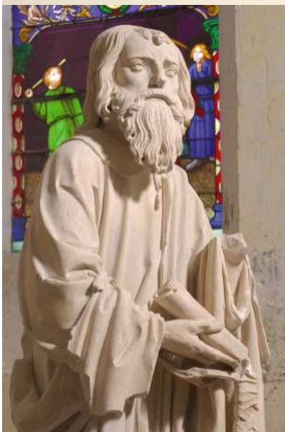
Saint Paul Saint-Pouange (10)

Le vernissage de l'exposition aura lieu vendredi 17 avril 2009 à 17h30 à Troyes, en l'église Saint-Jean-au-marché.