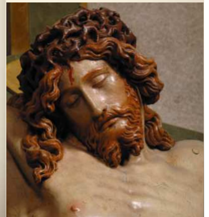
Christ en croix Reims (51)