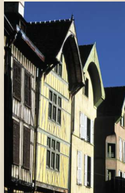
Troyes, maisons en pans de bois

Visite spéciale « Templiers » avec l'office du tourisme de Troyes.