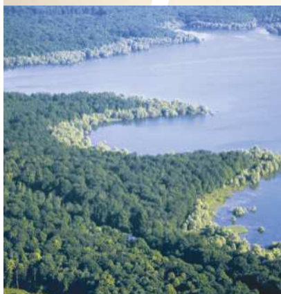
Les lacs du Parc naturel de la forêt d'Orient