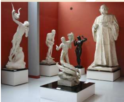
Récente extension du musée Dubois-Boucher, la galerie des sculptures offre une collection de plâtres modèles, dans une ambiance d'atelier.