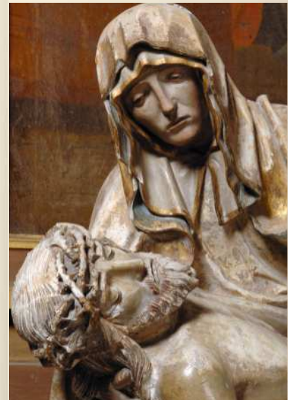
Vierge de Pitié Bayel (10)

Le style du Maître de Chaource est plein d'intériorité et de retenue. Ses personnages, à l'allure digne et aux volumes denses, présentent des visages empreints d'émotion et d'une subtile variété psychologique. L'expression réservée des figures exprime une grande sensibilité. L'idéal esthétique du Maître s'exprime dans des traits réguliers : des yeux plutôt grands, un nez parfaitement droit, une bouche discrète.