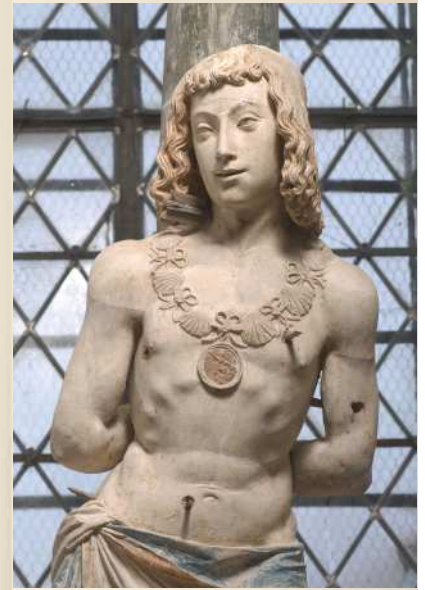
Saint Sébastien Vallant-Saint-Georges (10)

Le diocèse de Troyes contribue à la mise en valeur de cette sculpture religieuse en l'accueillant dans une église toujours consacrée au culte.