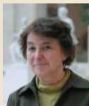
GENEVIÈVE BRES-CBAUTIER, CONSERVATEUR GÉNÉRAL CHARGÉE DU DÉPARTEMENT DES SCULPTURES AU MUSÉE DU LOUVRE PRÉSIDENTE DU COMITÉ SCIENTIFIQUE DE L'EXPOSITION.

L'exposition « Le Beau XVI e – Chefs-d'œuvre de la Sculpture en Champagne » mettra en valeur le patrimoine unique d'une région qui constitue un des berceaux de la sculpture du XVI e . Foyer d'excellence à la croisée de l'Italie, des Flandres et de l'Allemagne, la Champagne s'est inspirée des différents courants artistiques pour proposer une production nouvelle qui s'est rapidement imposée dans « l'orchestre européen ». Bien qu'étudié depuis le XIX e siècle, cet art a parfois été oublié au profit d'autres domaines de la création. A tel point que la dernière exposition de sculpture champenoise du XVI e datait de 1953 ! Aujourd'hui, l'exposition « Le Beau XVI e – Chefs-d'œuvre de la Sculpture en Champagne » fait renaître le rayonnement et la force de cet art dans un lieu historique récemment restauré : l'église Saint-Jean-au-marché de Troyes.