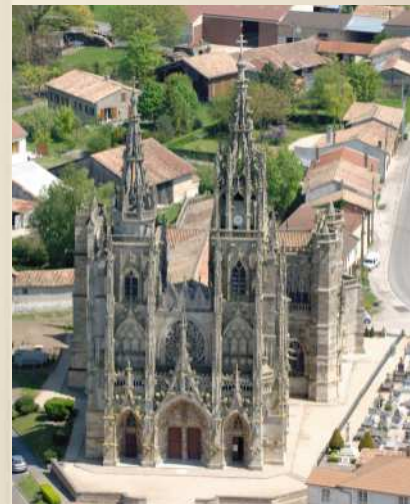
Basilique Notre-Dame de L'Épine (Marne)

Des églises à pans de bois de la région du Der aux places fortes ardennaises, en passant par l'architecture Art déco de la reconstruction de Reims, les grandes abbayes cisterciennes du Moyen-âge, le patrimoine industriel du XIX e siècle ou encore les chefs d'œuvres du gothique flamboyant, près de 1500 édifices et objets sont aujourd'hui concernés par les mesures de protection et de conservation.