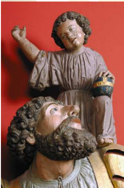
Saint Christophe Châlons-en-Champagne (51)

Pour garder la mémoire du rassemblement unique de ces chefs-d'œuvre, et conserver les connaissances acquises sur le sujet, un catalogue de l'exposition « Le Beau XVI e - Chefs-d'œuvre de la Sculpture en Champagne » est disponible à partir d'avril 2009 aux Éditions Hazan. Neuf auteurs concourent à la rédaction des trois cents pages de l'ouvrage qui sont rythmées par de nombreuses photographies de sculptures exposées ou à découvrir dans les églises de l'Aube, de la Marne, de la Haute-Marne, de la Seine-et-Marne et dans les collections des musées. Jean-René Gaborit, Geneviève Bresc-Bautier, Véronique Boucherat, Marion Boudon-Machuel, Maxence Hermant, Sophie Guillot de Suduirant vous invitent dans l'intimité de ces sculptures, offrant toutes les clés de lecture et de compréhension nécessaires à l'approche de ce patrimoine.