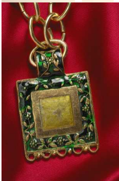
Copie de bijou pour homme réalisée par l'atelier d'insertion sociale d'Aix-en-Othe (Aube).