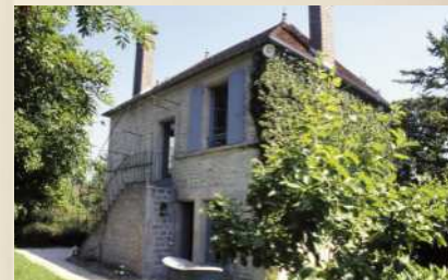
L'atelier du peintre sculpteur Pierre-Auguste Renoir

En attendant, le musée de sculptures Dubois-Boucher fait déjà référence, avec plus de 400 œuvres pour la période fin XIX e . Il abrite déjà 3 œuvres de Camille Claudel, dont Persée et la Gorgone, marbre monumental classé « d'intérêt patrimonial majeur ».