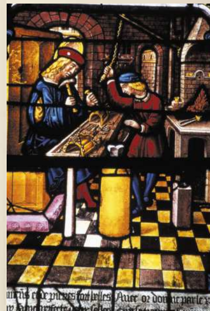
Sculpture et vitrail du XVI e , deux priorités culturelles en Champagne-Ardenne La légende de Saint Éloi Église de la Madeleine - Troyes (10)

Portée par des acteurs institutionnels, l'exposition est également ouverte à des partenariats extérieurs.