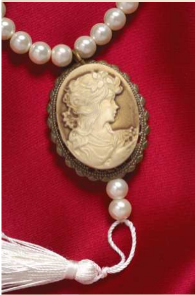
Copie de bijou pour femme réalisée par l'atelier d'insertion sociale d'Aix-en-Othe (Aube).