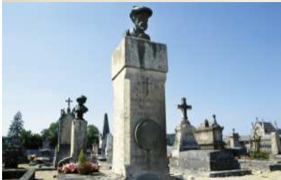
Tombe de Pierre-Auguste Renoir, © Conseil général de l'Aube, Phillipe Pralraud

L'Aube, un département où souffle l'esprit de Renoir, de Camille Claudel et des Templiers