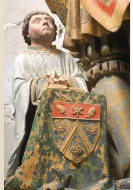
Saint Gengoul Rouilly-Sacey (10)

Cette remarquable effervescence de la production artistique est appelée « Le Beau XVI e siècle troyen ».