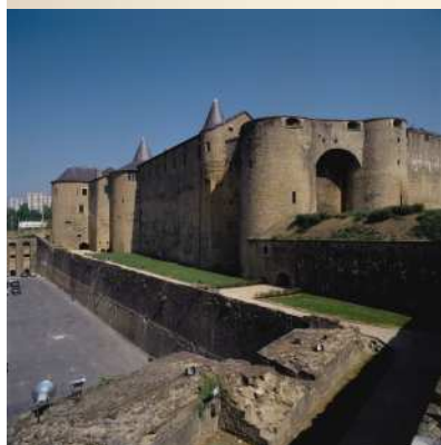
Château-fort de Sedan (Ardennes)

La mise en valeur de ce patrimoine d'une exceptionnelle qualité est inscrite au titre du contrat de projets entre l'Etat et la Région, et plus précisément autour de trois thématiques ciblées : le vitrail, la statuaire et l'architecture fortifiée, particulièrement remarquables en Champagne-Ardenne. Elle se concrétise par des programmes de restauration et de création, des publications et des expositions sur l'ensemble du territoire.