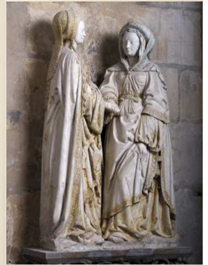
La Visitation Troyes (10)