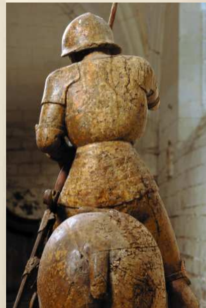
Saint Georges terrassant le dragon Laubressel (10)