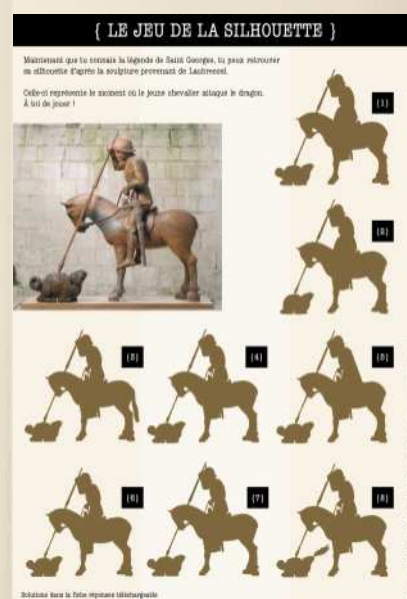
Exemple de jeu téléchargeable sur www.sculpture-en-Champagne.fr